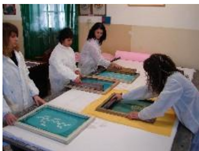
ISA di Anagni, Studentesse nel laboratorio di Moda e costume

La mostra, visitata da numeroso e qualificato pubblico, è stata molto apprezzata tanto che ne è stata prolungata l'esposizione nei locali del Palazzo Consolare a partire dal 14 dicembre 2009 e per tutto il periodo delle festività natalizie 2009-2010.