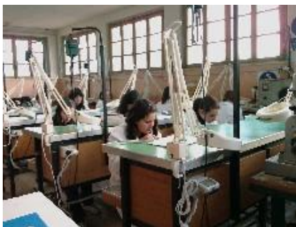
ISA di Anagni, Studentesse nel laboratorio di Oreficeria

Sono stati esposti lavori provenienti dai Laboratori di Oreficeria, Progettazione, Moda e Costume, Arte del tessuto, Ebanisteria, Disegno e Architettura